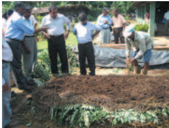
අංක 04: කෙෂ්ත්‍රයේ ප්‍රායෝගිකව කාබනික පොහොර නිෂ්පාදන කරන එක් අවස්ථාවක්

අමු ශාක පත්‍ර සහ ලපටි කොටස් සඳහා ග්ලිරිසිඩියා සහ හත්තසූරිය සම සමච්ච යෙදීමෙන් ඉහළ ගුණාත්මයෙන් යුත් කොම්පෝස්ට් සාදා ගත හැක