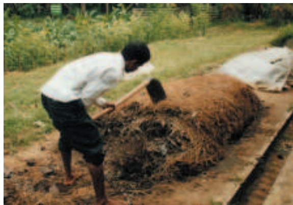
අංක 02: කාබනික පොහොර නිෂ්පාදනය කිරීමේදී මිශ්‍ර කරන එක් අවස්ථාවක්