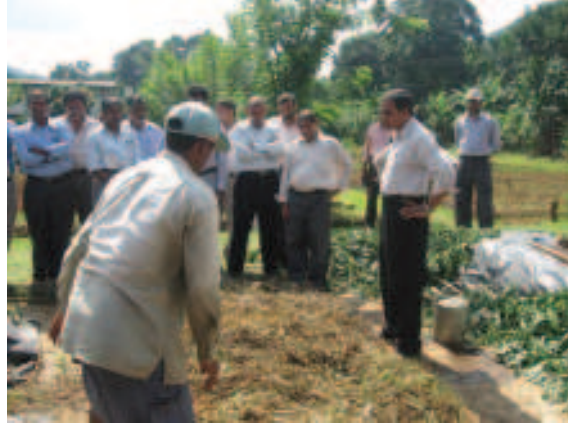
අංක 03: කෙෂ්ත්‍රයේ කාබනික පොහොර නිෂ්පාදනය පිළිබඳ හිඳබාරීන් දැනුවත් කරන එක් අවස්ථාවක්