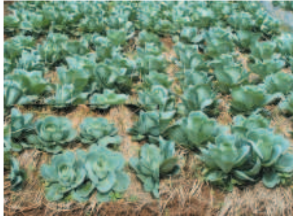
අංක 06: කාබනිකව වගාකල ගෝවා වගාවක අාවර්ණ බෝගයක් ලෙස පිපුරු භාවිතා කල අවස්ථාවක්