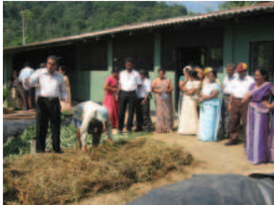
අංක 09: නිලධාරී ප්‍රගුණ කිරීමේ එක් අවස්ථාවක්

(වැඩි විස්තර සඳහා අපව විමසන්න දු.අ. 081-2388229)