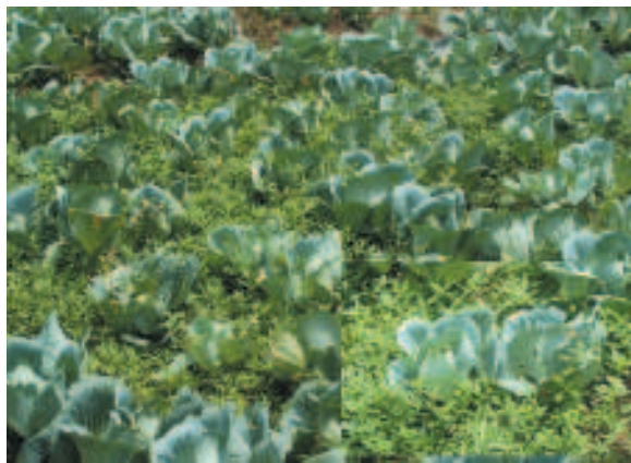
අංක 07: කාබනිකව වගාකල ගෝවා වගාවක අාවර්ණ බෝගයක් ලෙස මුකුණුවැන්න භාවිතා කල අවස්ථාවක්