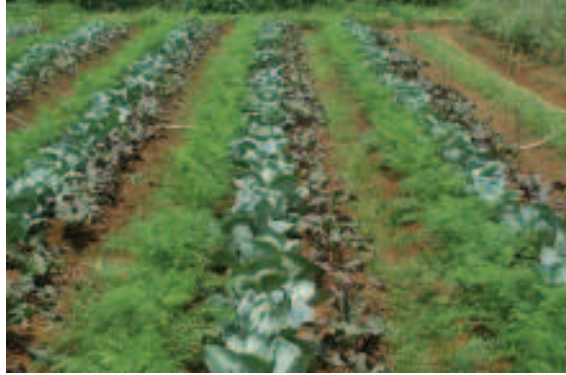
අංක 08: කාබනිකව වගාකළ මිශ්‍ර බෝග වගාවක නවත් එක් අවස්ථාවක්