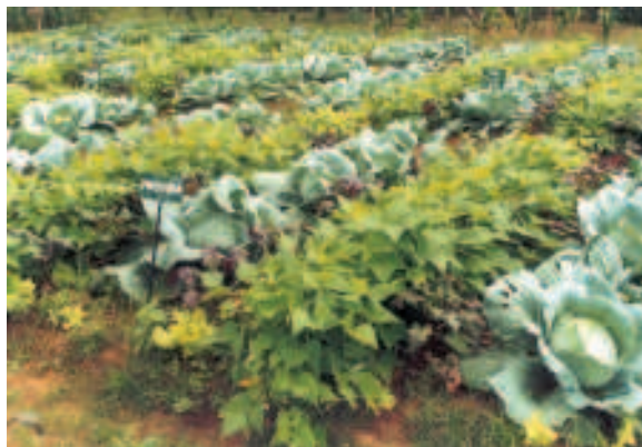
ඡායා 01: කාබනික කෘෂිකර්මයේ මූලධර්මානුකූලව වගාකල මිශ්‍ර වළවැළි වගාව

1960 දශකයේ සිට කාබනික කෘෂිකර්මාන්තය පිලිබඳ විශේෂ නැඹුරුතාවයක් දැක්වීමට බොහෝ සේ ඉවහල් වූයේ කෘෂිකර්මාන්තය යාන්ත්‍රීකරණය වීමත් කෘමිනාශක අවශේෂ ආහාරවල තැන්පත් වීම සෞඛ්‍යට ගැටළු රැසකට හේතු වීමත්, පීචින් හා ඔවුන්ගේ වාසස්ථාන විනාශ වීමත්, පරිසර දූෂණය බොහෝ සෙයින් සිදුවීමත්ය.